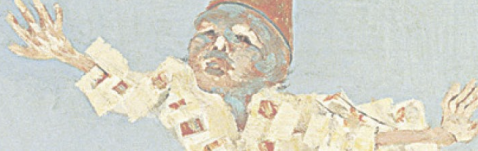
Figura 1 - Carta ao estudante